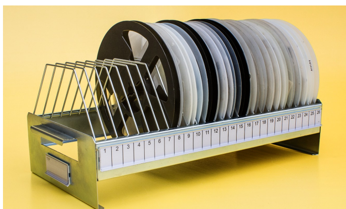
magazynowanie 26 standardowych szpul o średnicy ok. 180 mm i szerokość ok. 11,5 mm